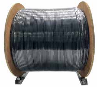
光缆光纤折叠收放线器